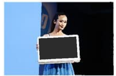
HP 大型21.5インチタブレット

本格的な成長期を迎えていると言われるクラウド市場はクラウド2.0と呼ばれる新たなステージに入り、不特定多数のユーザーがブロードバンドインターネットを利用して、高度なITサービスをテレビのような簡単な操作で安価に共同利用するのが当たり前になります。